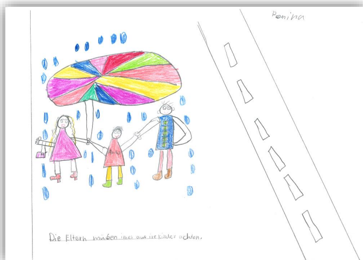
Zeichnung: Romina, Alter unbekannt

Ende 2019 liefert der Kanton St.Gallen erneut Daten für die nächste Berichterstattung der Schweiz zur UN-Kinderrechtskonvention. Darauf folgen Empfehlungen an die Schweiz für Verbesserungen. Der Kanton St.Gallen wird sich daran orientieren und weitere Impulse setzen. Ein stetes Engagement ist nötig, um Kinderrechte nachhaltig im Denken und Handeln zu verankern.