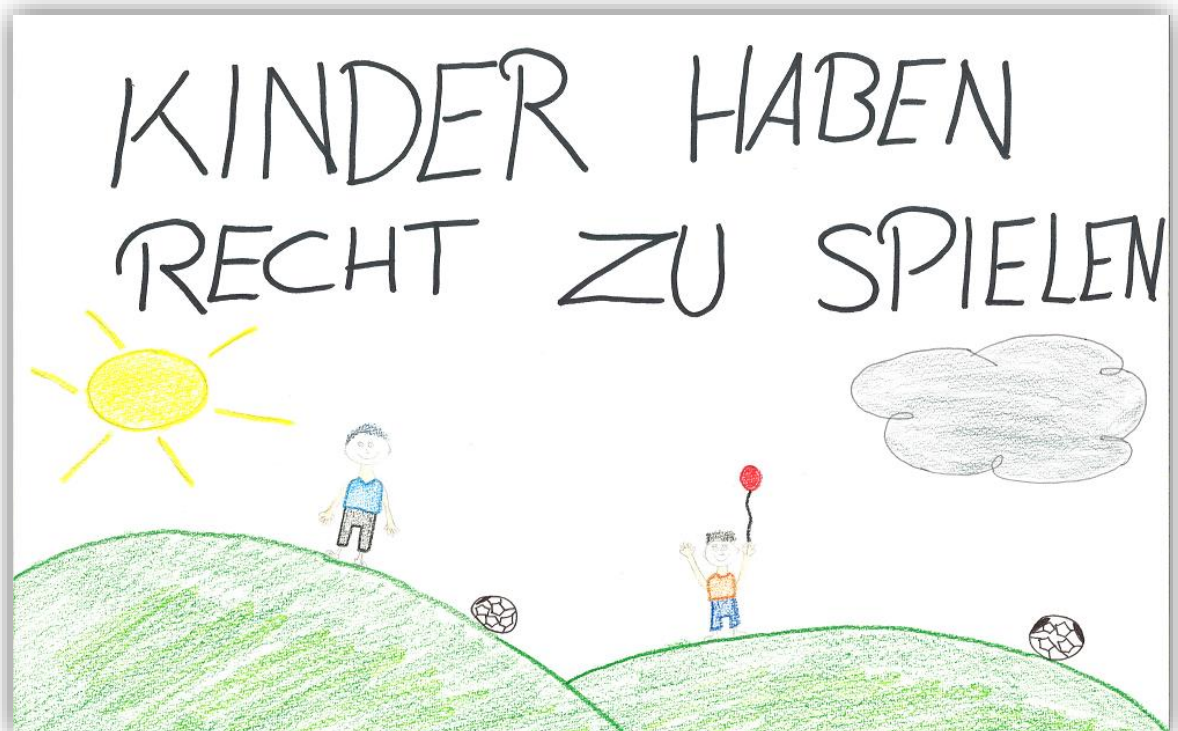
Zeichnung: Lendi, 11 Jahre

Es gibt keinen Grund, weshalb wir uns nicht auf ein anzustrebendes Ideal beziehen sollten, selbst wenn es in der Alltagspraxis aus unterschiedlichen Gründen schwierig bis unmöglich erscheint, diesem Ideal je gerecht zu werden. Sowohl Fachpersonen der Kinder- und Jugendhilfe und Bildung als auch Eltern und weiteren Entscheidungstragenden kann es nämlich dennoch als Reflexionsfolie dienen, das alltägliche Handeln in den Organisationen in zwei grobe Kategorien zu unterscheiden: in «eher förderliches Handeln» bzw. «eher weniger förderliches Handeln» in Bezug auf das Kindeswohl. Zur Umsetzung der Kinderrechte braucht es alle Erwachsenen, welche die Verantwortung für unsere Kinder gemeinsam tragen wollen und sich u.a. dafür einsetzen, dass Kinderrechte nicht nur auf dem Papier stehen, sondern als gelebte Praxis erkennbar sind. Kinder brauchen unser Vertrauen in ihre Fähigkeiten und ihr Potential sowie unsere Bereitschaft, uns durch ihre Perspektive bereichern zu lassen und von ihnen zu lernen.