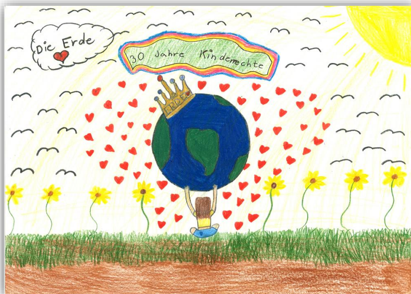
Zeichnung: Ema, 11 Jahre

Am 20. November 2019 wird die UN-Kinderrechtskonvention 30 Jahre alt. In dieser Zeit hat sich einiges bewegt und doch besteht weiterhin Entwicklungsbedarf in verschiedenen Bereichen der Umsetzung der Kinderrechte. Aus diesem Grund nehmen zahlreiche Fachpersonen das Jubiläum zum Anlass, die Kinderrechte als wichtige Errungenschaft zu feiern und gleichzeitig die Öffentlichkeit verstärkt für die Kinderrechte zu sensibilisieren.