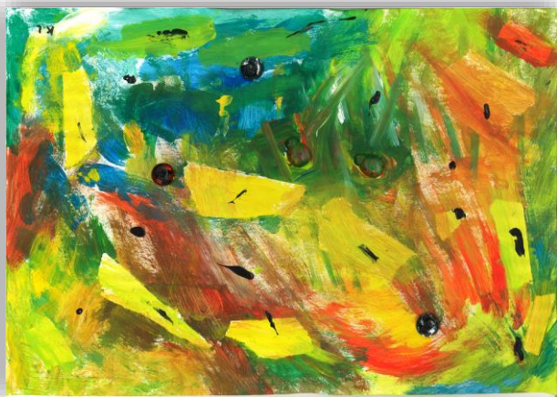
Zeichnung: Kevin, 4 Jahre

Das sagt der Papa immer zum Räuberkind und den Papa mag es auch sehr gerne. Die halbe Woche wohnt das Räuberkind beim Papa und da wohnt es am liebsten, weil es da das beste Essen der Welt gibt. Die andere Hälfte wohnt es bei der Mama und da wohnt es am liebsten, weil man so lange aufbleiben darf. «Es ist ein bisschen wie zweimal die Woche in die Ferien fahren, man muss den Rucksack packen mit all den Sachen, der Gartenkatze tschüss sagen und all so was, aber dafür bekommt man auch zweimal Eis, wenn man nicht verrät, dass man schon welches hatte», sagt das Räuberkind verschmitzt.