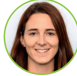
Miriam Hürlimann Kommunikation